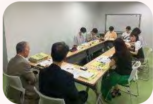
新潟県国際交流協会ヒアリング