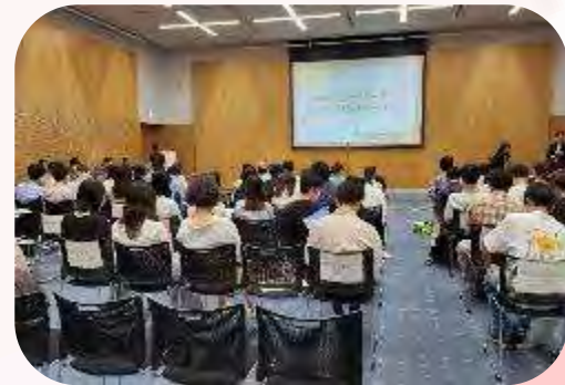
国際交流ファシリテーター・ キックオフセレモニー