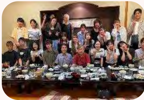
佐々木ゼミとの交流会