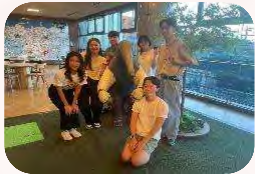
海外移住資料館訪問