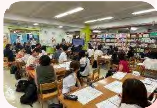
横浜市立南吉田小学校の教員向け ワークショップ